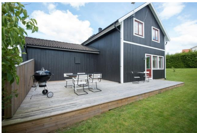
Trädäck på mark.