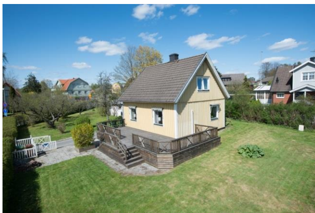
Upphöjd uteplats.

De villor som byggdes i Sverige fram till 1980-talet har ofta en markant sockel eller grundmur med en påtaglig höjdskillnad mellan marknivån och byggnadens huvudsakliga bostadsplan. Vid entréer tas höjdskillnaden vanligen upp med ett antal trappsteg. Uteplatsen till dessa hus var ursprungligen ofta en stenläggning på marken som man gick ner till från bostaden. För att göra uteplatsen mer tillgänglig och användbar har det blivit allt vanligare att den anordnas utan nivåskillnad till entréer. Det sker ofta genom att uteplatsen anordnas på en upphöjd träkonstruktion.