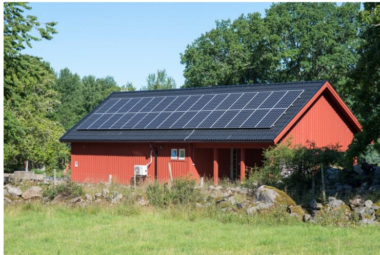
Solcellspaneler på tak.

Den successiva förändringen av bebyggelsen sker oberoende av om solenergianläggningarna är bygglovspliktiga eller inte. Trots att en ansökan om bygglov för en solenergianläggning kan avslås i det enskilda fallet och att solenergianläggningar omfattas av byggnadsnämndens tillsynsansvar styr samhällets bestämmelser i praktiken inte bebyggelseutvecklingen i detta avseende i någon större utstäckning. I viss mån liknar utvecklingen den som skett för andra ändringar av byggnader som i mycket olika utsträckning prövas i bygglov, exempelvis antenner för mobil data trafik eller kyl- och ventilationsanläggningar.